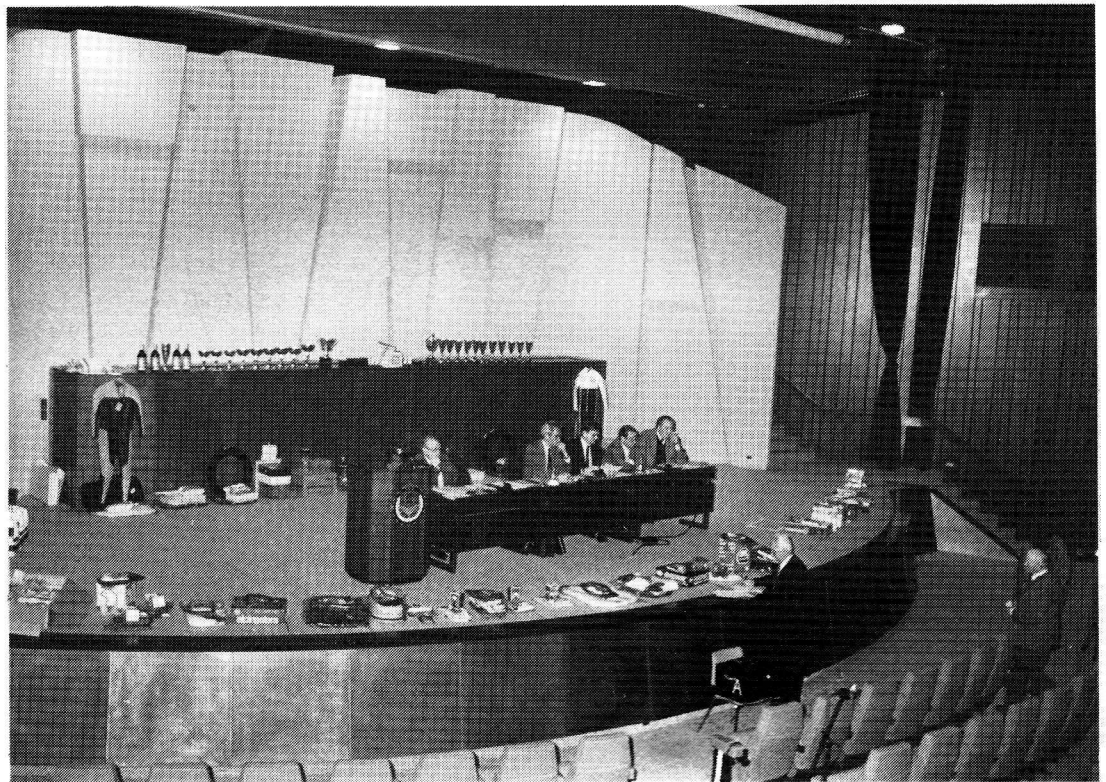
Merci les sponsors: une avalanche de cadeaux pour les Touristes perdus dans une salle trop grande.

annuel la crise et les malentendus, il terminait en déclarant: «En ce qui concerne le tourisme motocycliste, nous sommes fermement convaincus qu'après avoir enregistré une forte prise de conscience, un vent de renouveau soufflera dans ce domaine. Les premiers symptômes d'un nouvel essor s'enregistrent déjà